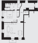
Carlton Suite (ca. 95 m 2 )