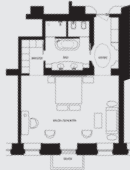
Junior Suite (ca. 65 m 2 )