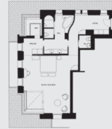
Corner Junior Suite (ca. 75 m 2 )