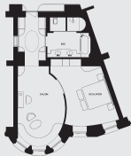
Deluxe Suite (ca. 70 m 2 )