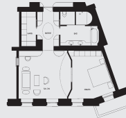
Grand Suite (ca. 75–80 m 2 )