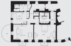
Zaren Suite (ca. 160 m 2 )